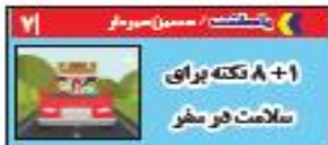
۱+۸ تکه برای سلامت در سفر

مدیرکل شیلات گیلان خیر داد: گیلان پیش‌رو در تولید و صادرات خوراک آبزیان