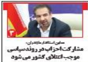
مدیر استعمار مازندران: مشارکت احزاب در روند سیاسی موجب انتقالی کشور می شود