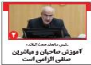
رئیس سازمان صحت گیلان: آموزش صاحبان و مباشرین صافی الزامی است