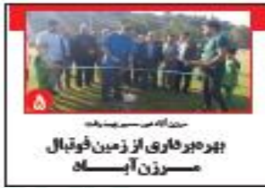
مدیر امور مسکن مازندران: بهره‌برفاری از زمین فوتبال مسرزن آبسک