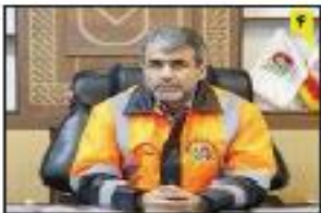
جهانبان مدیر کل حمل و نقل و راهداری مازندران: قیمت بلیت اتوبوس اربعین ۲۷ مرداد اعلام می‌شود