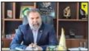
مخصوصی مدیر کل راه آهن شمال خبر داد: افزایش شدن ریل‌بانی دوم به مسیر راه آهن پل سفید تا گرگان