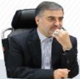
حسینی پور، استاندار مازندران تصریح کرد: