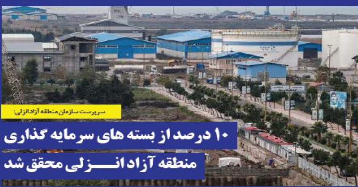
سرپرست سازمان منطقه آزاد انزلی:

فرمانده انتظامی گیلان نظرم و امنیت یکی از مهترین مطالبات مردم است