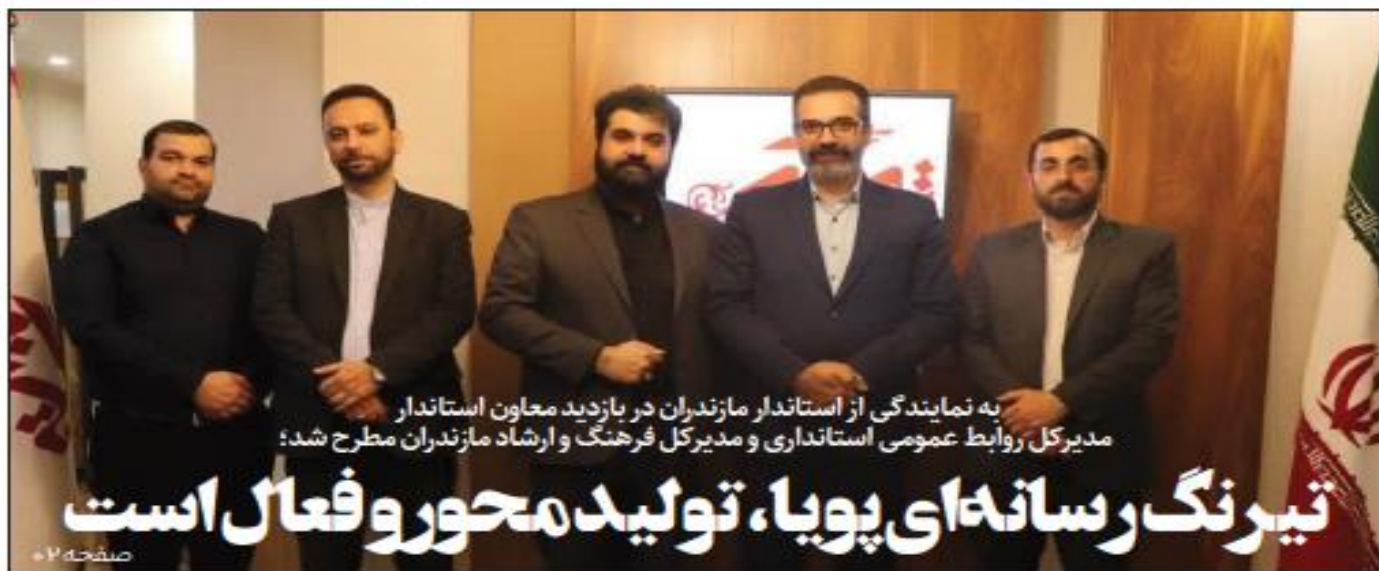
به نمایندگی از استاندار مازندران در بازدید معاون استاندار مدیرکل روابط عمومی استانداری و مدیرکل فرهنگ و ارشاد مازندران مطرح شد؛