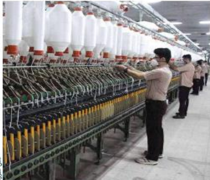
با وجود همه فراز و نشیب ها