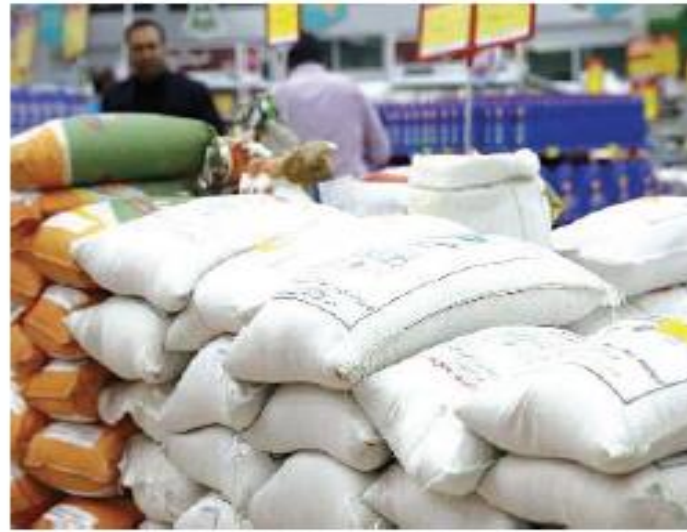
معاون اول رئیس جمهور اعلام کرد: