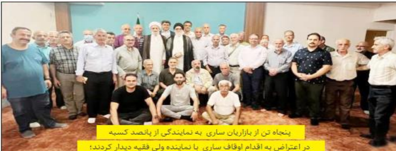
پنجاه تن از بازاریان ساری به نمایندگی از پانصد کسبه