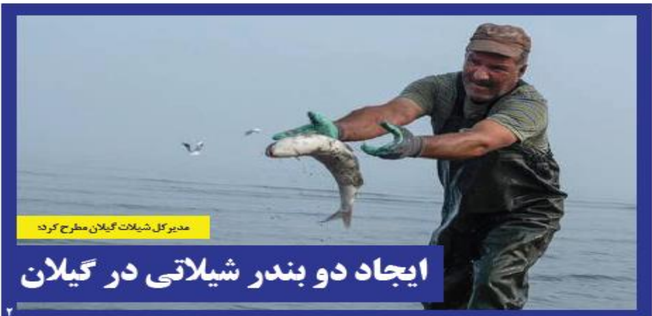
مدیرکل شیلات گیلان مطرح کرد:

مدیرکل صنایع بازرگانی گلستان با اذعان به ۶۰۹ میلیارد تومان طلب گندم کاران گلستانی باقی مانده است