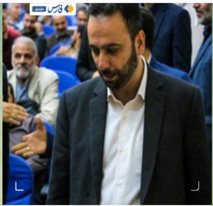
معارفه مدیر کل فرهنگ و ارشاد اسلامی مازندران

Pinned message تند باید پاسخ‌گو باشند! ! پ.ن: جناب رئیسی! بعد از گذشت دوسال از ع