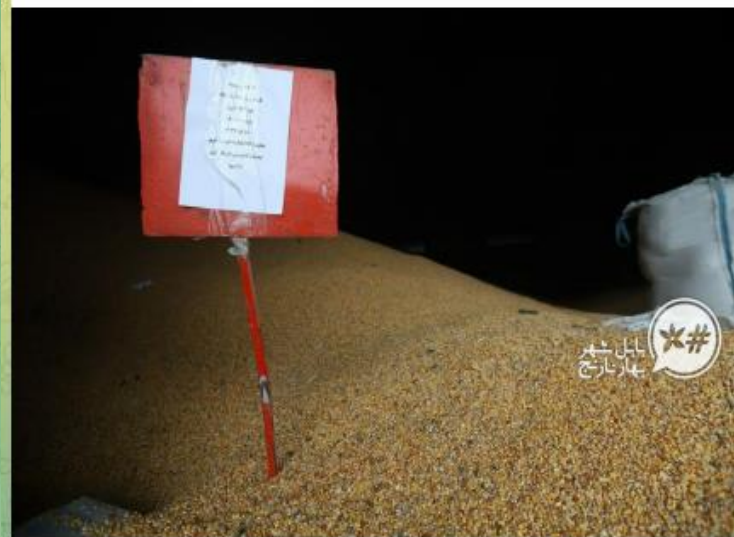
ذرت و روغن رسوبی بنادر مازندران تعیین تکلیف شد

...بازدید میدانی اژهای از بنادر استان مازندران رئیس قوه قضائیه خطاب