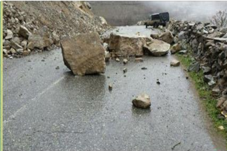
نقاط رانشی محور کندوان قبلا به وزارت راه اعلام شده بود

باشگاه خبرنگاران جوان مازندران ۱,۰۱۱ subscribers