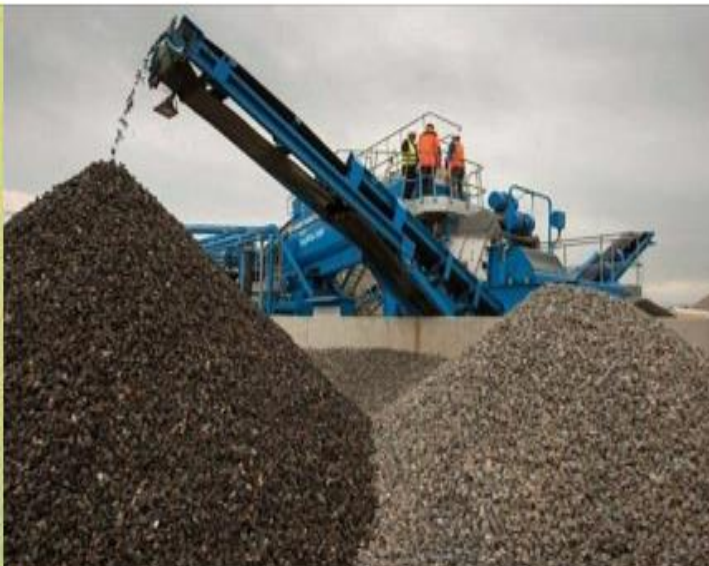
قیمت شن و ماسه در مازندران تعیین شد

موسوی معاون نظارت، بازرسی اداره کل صنعت، معدن و تجارت مازندران: در پی درخواست انجمن معدن استان مازندران مبنی بر افزایش قیمت شن و ماسه این موضوع در جلسات مختلف با حضور دستگاه های اجرایی بررسی و قیمت ماسه صفر شش به ازای هر تن ۱۶۲ هزار تومان بدون ارزش افزوده تعیین شده است.