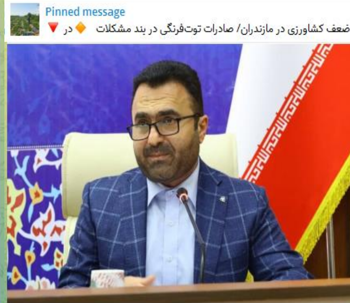
Pinned message ضعف کشاورزی در مازندران / صادرات توت‌فرنگی در بند مشکلات در