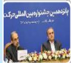
پانزدهمین جشنواره بین‌المللی حرکت

مدیر فرهنگی دانشگاه مازندران: بابلسر میزبان پانزدهمین جشنواره بین‌المللی «حرکت» می‌شود