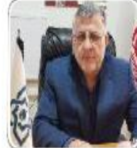
برایان بیش و بیار، میریس گنسه‌های خالی از آن گیسوت

مدیر کل بیمه سلامت مازندران: ۱۵ درصد زوج‌های مازندران نابارور هستند