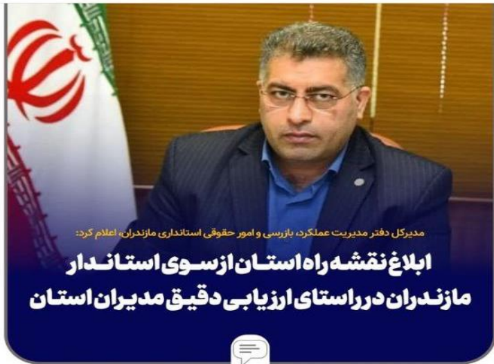
مدیرکل دفتر مدیریت عملکرد، بازرسی و امور حقوقی استانداری مازندران، اعلام کرد: