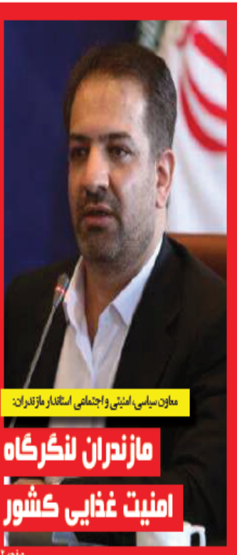
معاون سیاسی، امنیتی و اجتماعی استاندار مازندران: