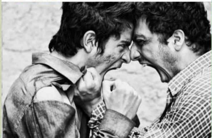
کاهش نزاع در مازندران