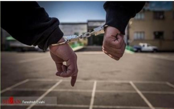
بازداشت اعضای شورا اسلامی و دهیار روستای دانیال و عوامل تیراندازی در این روستا