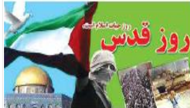
پنجشنبه ۲۲ فروردین ۱۳۸۰ - ۲۲ بهمن ۱۳۴۴ قمری - ۸ صفر ۱۳۸۰ شمسی - ۲۰۰۰ تومان