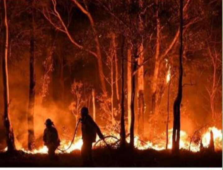
○ مهار آتش در جنگل‌های دشت بی نظیر نوشهر