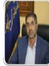
لیلیا یزیدیهی قدر را اگر کسی می‌داریم

مدیر کل فرهنگ و ارشاد اسلامی مازندران: ۲۰ اثر بومی در نمایشگاه کتاب مازندران رونمایی می‌شود