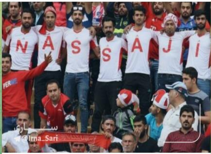
ماجرای بلیت رایگانی که پولی شد