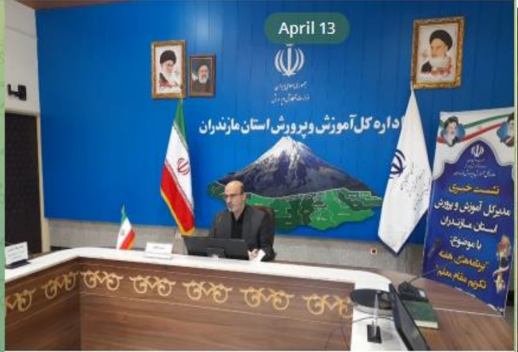
▼ مدیرکل آموزش و پرورش مازندران:

Pinned message ی دفاع از قدس شریف/فلسطین؛ آرمان همه مسلمانان و آزادی‌خواهان جها