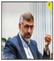
تربیت فرماندار ساری: مسئومیت سربازی دانش آموزان در ساری نادرست است

اجباری شدن مشاوره حقوقی مشاوران املاک ضرورتی اجتناب ناپذیر