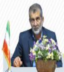
درباره شماره بزرگ