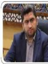
باران بیش و بیبار، همسایگانه های دانی از آن نیست

معاون اقتصادی استاندار مازندران مطرح کرد: کاغذبازی اداری مانع بزرگ سرمایه‌گذاری در مازندران