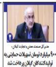
معاون استاندار مازندران، نازیبا بودن معیار سارق زیننده مرکز مازندران نیست