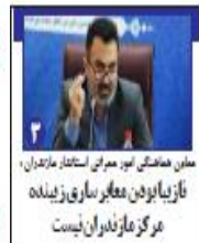
معاون اقتصادی امور، معاون استاندار مازندران، نازیبا بودن معیار سارق زیننده مرکز مازندران نیست