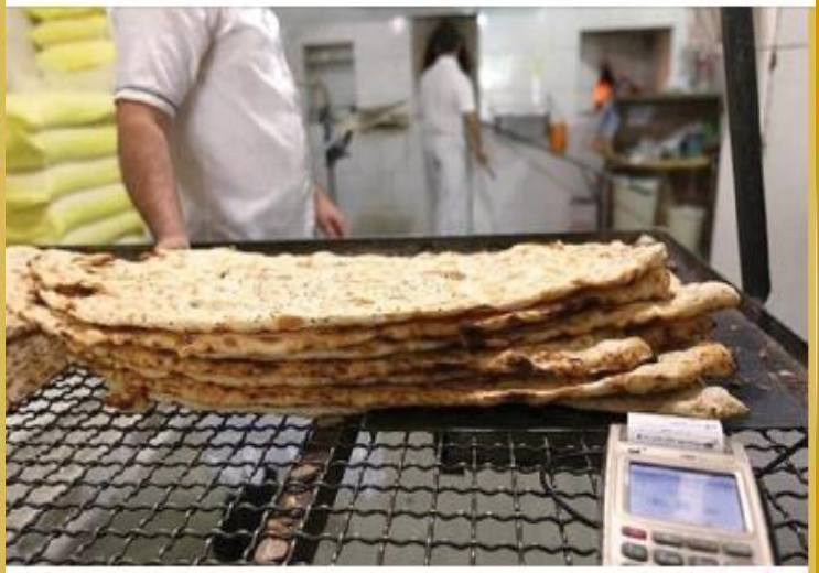
○ آغاز گام سوم هوشمند سازی عرضه نان از ۲۵ بهمن

Pinned message ان اطلاعات سپاه کربلا، شبکه پرننداز سازماندهی شده در فضای مجازی، که