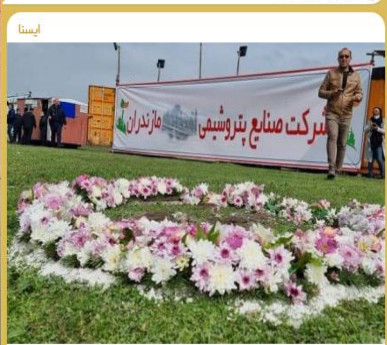
پاسخ محیط زیست برای ساخت پتروشیمی در مازندران " فعلا نه " است

Pinned message صفحه ویژه‌ای برای جشنواره‌های فجر ۱۴۰۱، اخبار، گزارش‌ها و تصاویر مریو