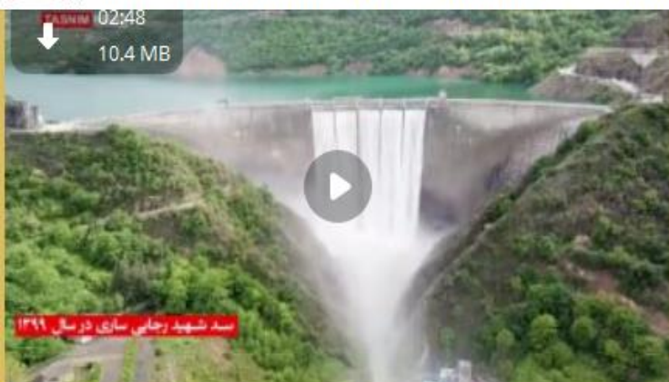
وضعیت بحرانی در بزرگترین سد مازندران

Pinned message بزرگ از ملت ایران: مطالبه مردم در رسانه‌ها؛ حقوق به تاراج رفته ملت