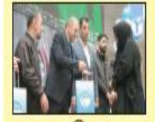
مدیر کل فرهنگ و ارشاد اسلامی مازندران در جلسه شورای فرهنگ عمومی استان: