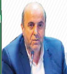
دربارین شماره بخوانید