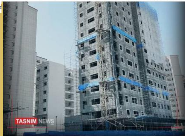
آغاز ساخت ۲۰ هزار مسکن کارگری در کشور

♦ تمام مراکز بهداشتی در شهرها و روستاهای استان آماده تزریق واکسن هستند