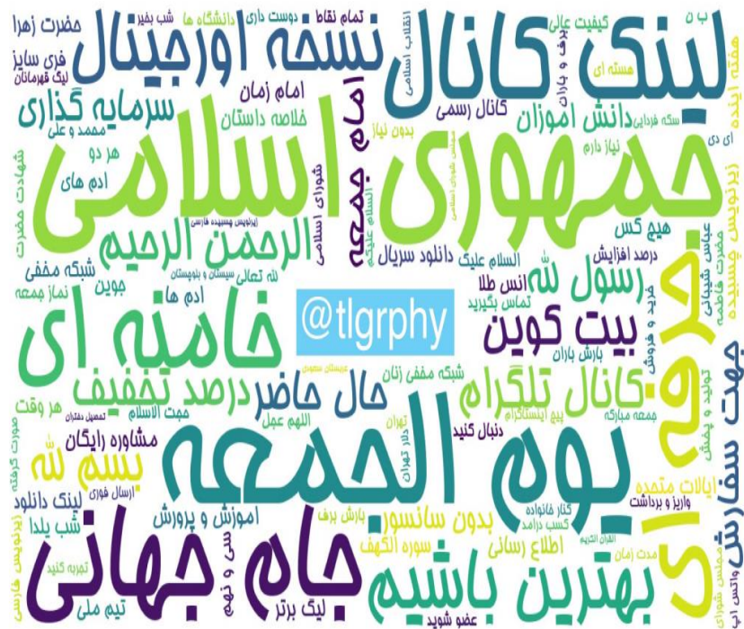
ابرواژه مطالب کانال های فارسی تلگرام در ۲۴ ساعت گذشته (بر حسب تعداد مطالب)