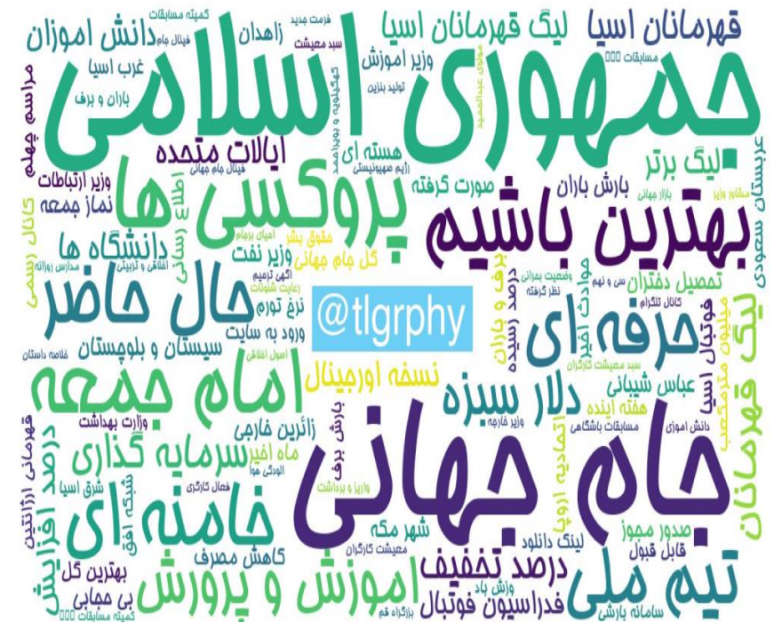
ابرواژه مطالب کانال های فارسی تلگرام در ۲۴ ساعت گذشته (بر حسب مجموع بازدید)