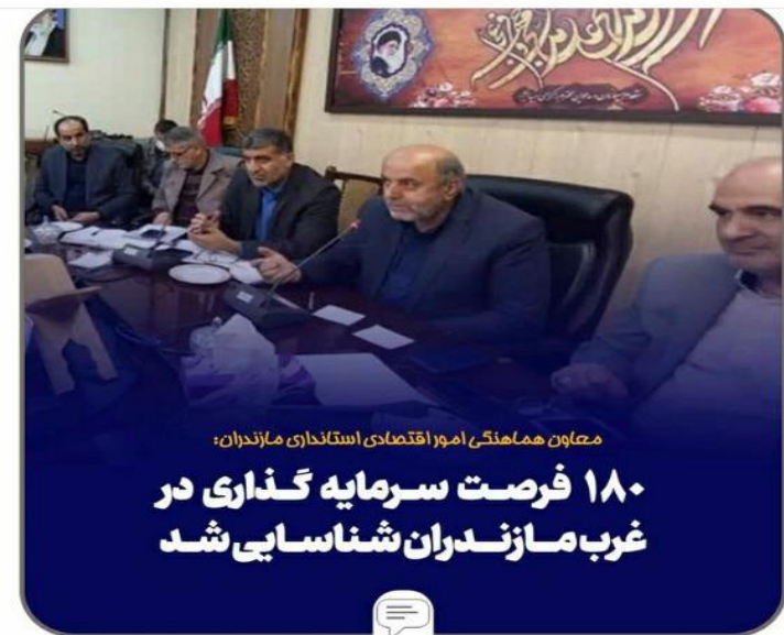
معاون هماهنگی امور اقتصادی استانداری مازندران:

۱۸۰ فرصت سرمایه‌گذاری در غرب مازندران شناسایی شد