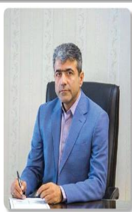
مدیرکل راهسازی و حمل و نقل چندی مازندران:

روکش آسفالت در ۳۳۵ کیلومتر از راه‌های ارتباطی مازندران انجام شد