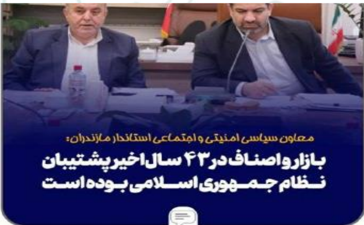
معاون سیاسی امنیتی و اجتماعی استاندار مازندران: بازار و اصناف در ۴۳ سال اخیر پشتیبان نظام جمهوری اسلامی بوده است