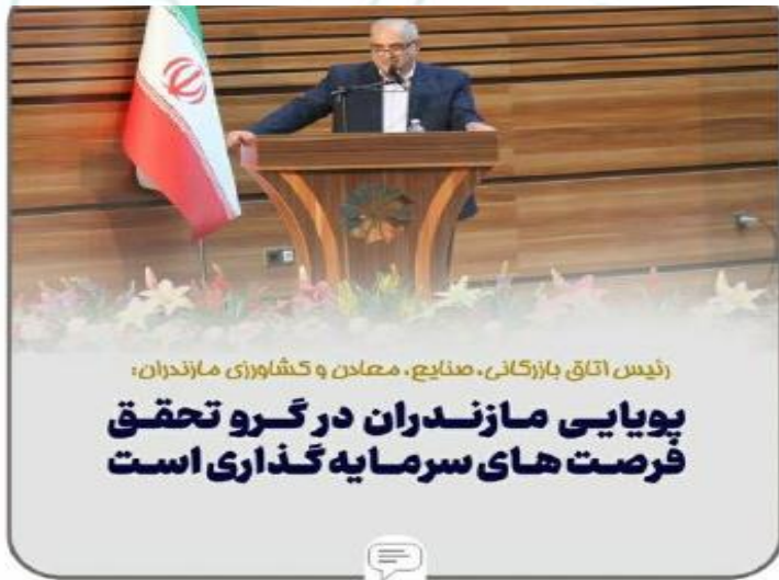
رئیس اتاق بازرگانی، صنایع، معادن و کشاورزی مازندران، پویایی مازندران در گرو تحقق فرصت‌های سرمایه‌گذاری است