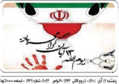
پنجشنبه ۱۲ آبان ۱۴۰۱ - ۸ ریح‌الثانی ۱۴۴۴ - ۲۰۲۲ شماره ۱۲۲۹ - صفحه ۲۰۰۰ تومان