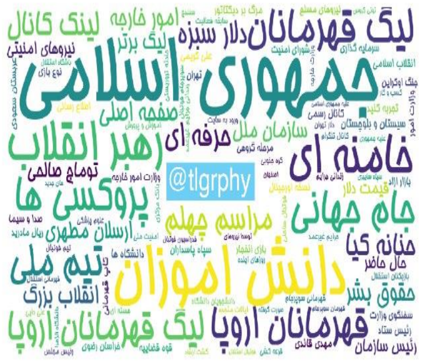
ابرواژه مطالب کانال‌های فارسی تلگرام در ۲۴ ساعت گذشته (برحسب مجموع بازدید)