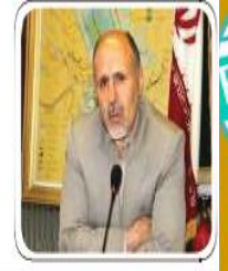
ولادت امام حسن عسکری علیه السلام مبارک باد

مدیرکل بنار و دریابوری مازندران خبر داد: انباشت گل ولای خطر جدی در دریای خزر