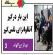
این بار درگیر آنفلوآنزای نرس گیر عیازیر بودند

مدیر کل میراث فرهنگی، گردشگری و صنایع دستی گیلان: