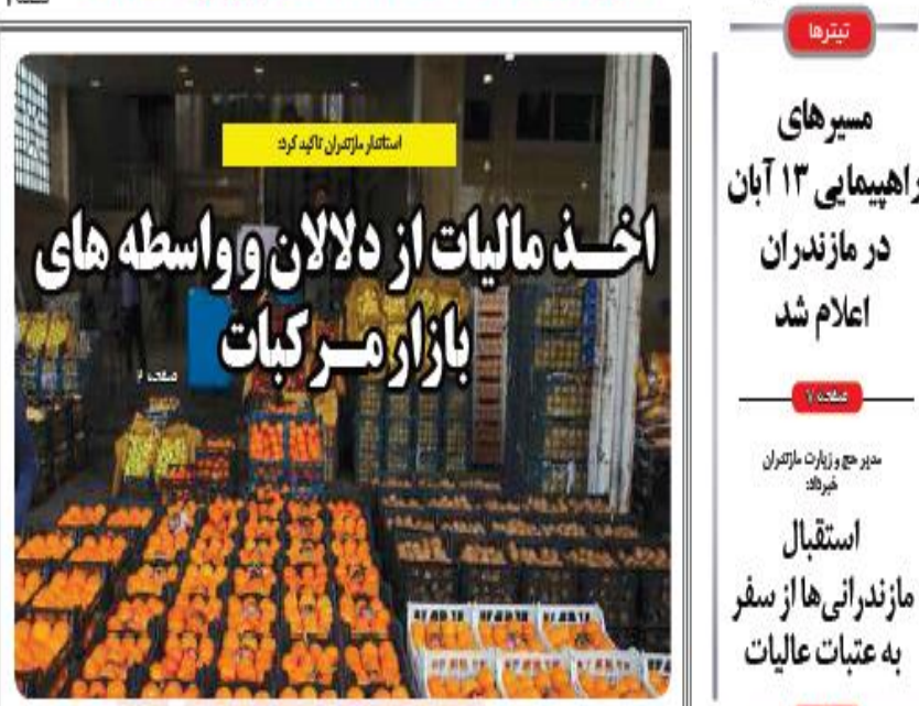
استاد مازندران تاکید کرد