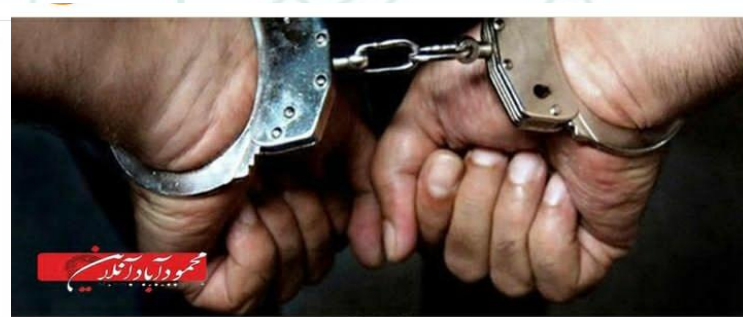
استاندار ۷۰ درصد دستگیر شدگان اغتشاشات مازندران مصرف مواد مخدر صنعتی داشته

💎 همچنین به منظور تسریع در آغاز عملیات اجرایی فرایند تأمین مالی پروژه آزادراه چالوس - رامسر، با صدور مجوز به وزارت راه و شهرسازی برای انعقاد قرارداد با «شرکت احداث، نگهداری، بهره برداری و انتقال آزادراه چالوس - رامسر» به سهامداری کنسرسیوم بانک‌های مسکن، ملی، ملت، تجارت، صادرات، سینا، کارآفرین و گروه کاپداج (شامل شرکت‌های پرلیت، استراتوس، جهان پارس، آبادراهن پارس و دیداس) موافقت کرد.