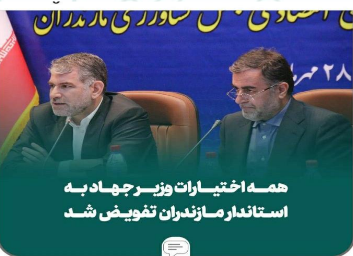
همه اختیارات وزیر جهاد به استاندار مازندران تفویض شد

وی با اعلام اینکه مواد مخدر صنعتی بزرگترین تهدید جوانان است، گفت: یکی از راهکاری رفع مشکلات و معضلات اعتیاد توجه به حوزه اشتغال است. استاندار مازندران اضافه کرد: در هر سفر شهرستانی که مراجعه می‌کنم؛ عمده درخواست مردم در حوزه اشتغال است و برخی از مدیران چشم خویش را به روی این واقعیت‌ها بسته‌اند.