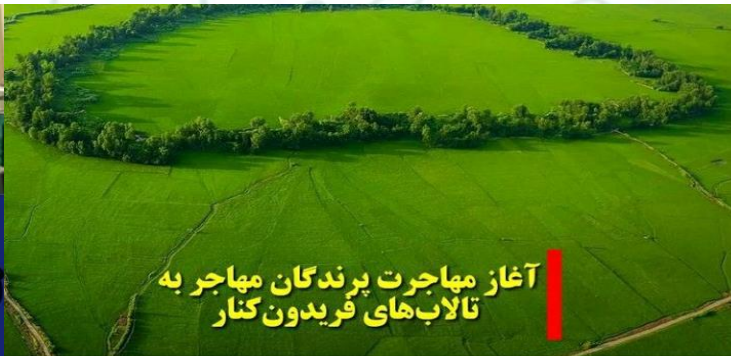
آغاز مهاجرت پرندگان مهاجر به تالاب‌های فریدون کنار

Liked by pedram_rezaei_kalantari and 62 others noora.mohammadi_reporter استاندار مازندران: مانعی برای صادرات کیوی مازندران وجود ندارد / تقویت دیپلماسی بازرگانی در راستای افزایش صادرات محصولات باغی استاندار مازندران در جلسه کارگروه صادرات مرکبات و کیوی به چین با عنوان اینکه موضوع صادرات محصولات باغی استان مازندران از اهمیت ویژه ای برخوردار است و در سطح ملی مطرح است، خاطرنشان کرد: در حال حاضر سه کشور هند، روسیه و چین بعنوان سه اولویت صادراتی مازندران مطرح است که در تلاش هستیم ظرفیت صادراتی مرکبات مازندران را هر سال نسبت به سال قبل افزایش دهیم تا به سقف ۱ میلیون تن صادرات در مازندران برسیم. دولت و مدیران دستگاه‌های اجرایی با ریل گذاری های انجام شده حامی واقعی رونق بازار و صادرات محصولات کشاورزی به ویژه کیوی و مرکبات مازندران هستند.مانعی برای صادرات کیوی مازندران وجود ندارد.