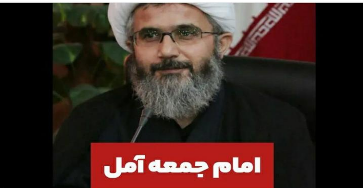
امام جمعه آمل

شاید مردم ندانند اما آلبانی نشین‌ها (منافقین) برای تصرف آمل پیام داده بودند