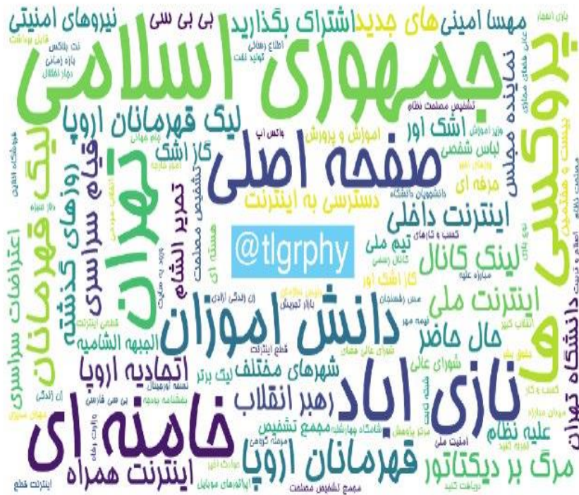
ابروازه مطالب کانال‌های فارسی تلگرام در ۲۴ ساعت گذشته (برحسب مجموع بازدید)