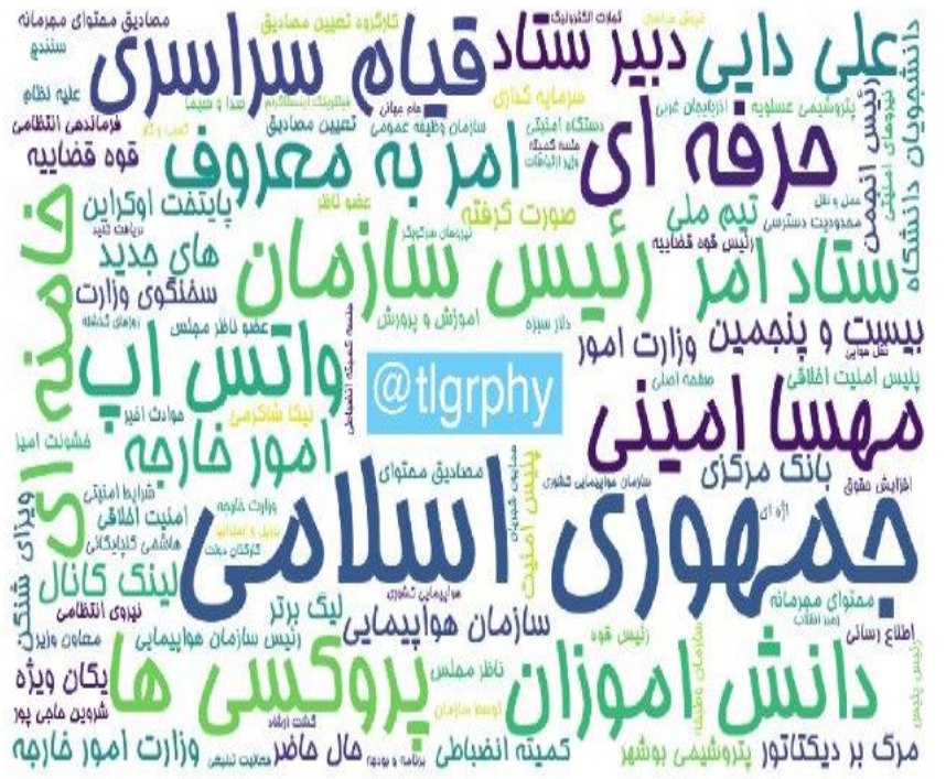
ابرواژه مطالب کانال‌های فارسی تلگرام در ۲۴ ساعت گذشته (برحسب مجموع بازدید)