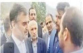
تنگابنی ها امروز میزبان استاندار مازندران و ۶۵ مدیرکل استانی در ششمین سفر شهرستانی