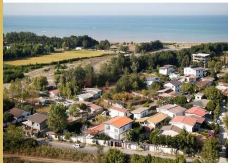
سند اراضی ساحلی چالوس به نام دولت اخذ شد

هادی بزرگی مازندرانی رئیس اداره منابع طبیعی و آبخیزداری شهرستان چالوس: