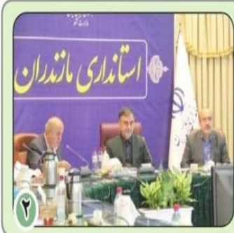
استاندار مازندران خبر داد

۵ رئیس دانشکده علوم پزشکی مازندران، گزارش کمی و کیفی خدمات حوزه سلامت در سطح استان از اهداف مهم اسرآنژنگ دانشگاه علوم پزشکی مازندران است