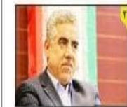
عباسی، استاندار گیلان برگشت حتی یک ریال از بودجه دستگاه های گیلان قابل پذیرش نیست

زنده نگه داشتن یاد و خاطره شهدا یک ضرورت است