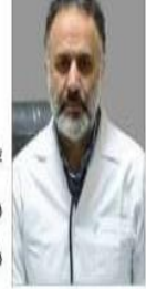
با مشارکت خیران سلامت جمع آوری شد

سال هفتم و شماره ۱۲۱۸ یکشنبه ۲۰ شهریور ۱۴۰۱ صفحه اولین ۲۰۰ تومان