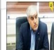
مدیر کل فرودگاه های مازندران خبر داد: برقراری اولین سورتی پرواز مسقط- نوشهر

زنده نگه داشتن یاد و خاطره شهدا یک ضرورت است