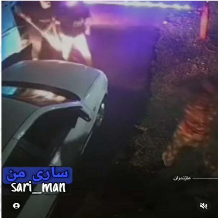
ساری من Sari_man