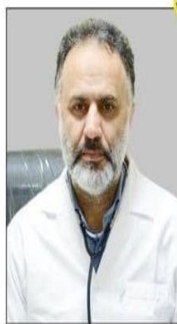
رئیس دانشگاه علوم پزشکی مازندران:

دولت سیزدهم در راستای ایجاد و حمایت از طرح های مشاغل خانگی و کسب و کارهای خرد و کوچک، تسهیلات مطلوبی را برای روستاییان با نرخ سود چهار درصد در نظر گرفته است.