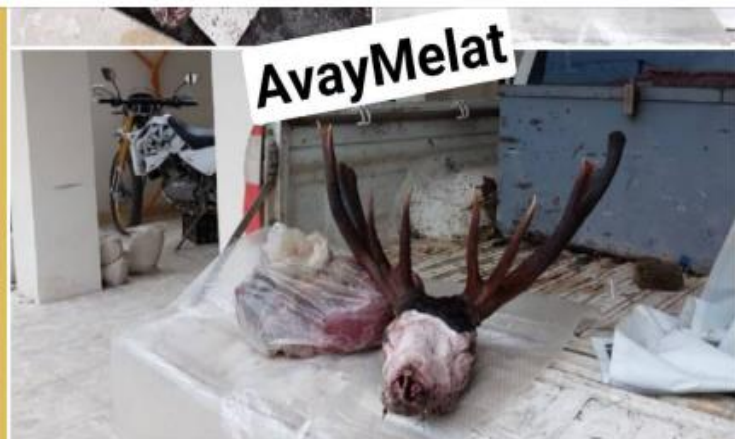
قتل مرال‌ها در فصل گاوپانگی نوشهر/ دستور صریح دادستان نوشهر در تعقیب و دستگیری شکارچیان غیرمجاز

Pinned message ستوه آمدند!! 🔺 تنها خواسته بحق مردم غرب استان جدایی از شرق استان اس