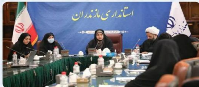
مدیرکل امور زنان و خانواده استاندارای مازندران

"طی سال‌های اخیر اقدامات مختلفی در این زمینه آغاز شد اما به نقطه‌ای که باید تاکنون نرسیده که امیدواریم هرچه زودتر این مهم محقق شود، بحث آزادسازی سواحل اهمیت این موضوع را دوچندان کرده است که امیدواریم اقدامات و خبرهای مختلف در این زمینه به سرانجام برسد."