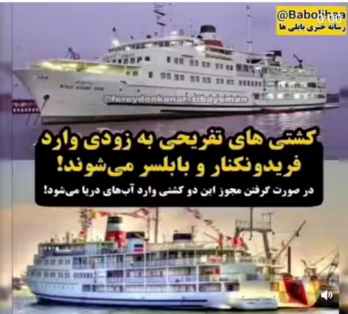
@Babolihaa رسانه خبری بابلی ها