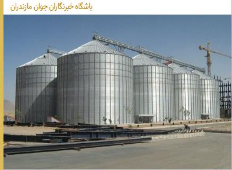
باشگاه خبرنگاران جوان مازندران

#مازندران_خبر بزرگترین پایگاه خبری #مازندران #۲۵ مرداد ۱۴۰۱ #ورود