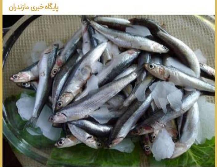
پایگاه خبری مازندران