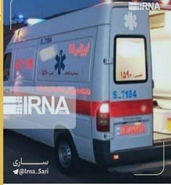
اورژانس مازندران با کمبود پایگاه و نیرو مواجه است

رئیس مرکز مدیریت حوادث و فوریت‌های پزشکی مازندران: به دلیل کمبود پایگاه و نیروی انسانی، اورژانس استان به خصوص در ساری با مشکلات جدی در ارائه خدمات مطلوب به شهروندان مواجه است.