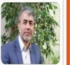
نقدیر از ممبران راهماری و حمل و نقل جاده ای مازندران