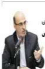
سرمستاد انجمن آموزش و پرورش استان پروژه مهر باید یونانی را در مدارس مازندران به ارمغان آورد

چهارشنبه ۵ مرداد ۱۳۹۴ / شماره ۲۲۳ / سال مقيم / شماره ۲۲۳ / صفحه ۲ - تهران