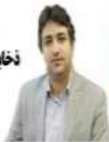
مدیرکل بانک مغان خن گیلان ذخایر خونی گیلان در وضعیت قرمز قرار دارد