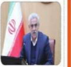
ناکده استاندار گلان بر عايت موافق بيهي اس کرونکي