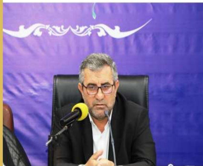
▲ افزایش ۱۰ درصدی کشت مکانیزه در شالیزارهای مازندران

♦ عنایتی رئیس سازمان جهاد کشاورزی مازندران: