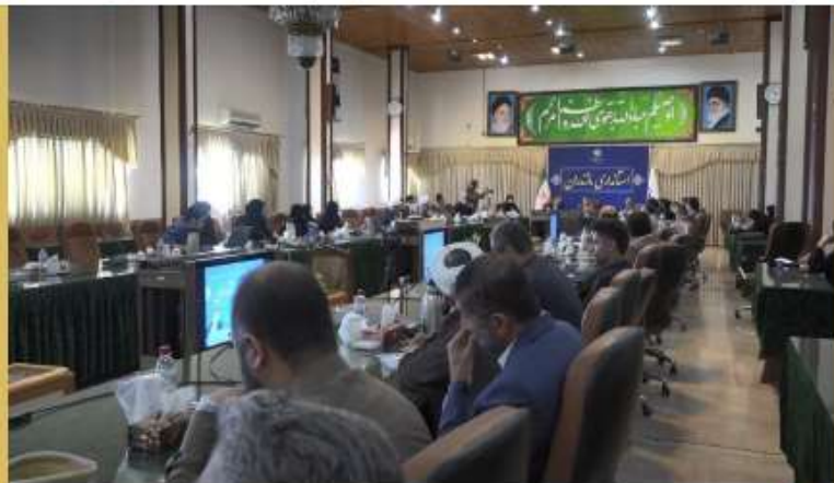
● شاخص‌های جمعیتی مازندران در وضعیت بحران

از سوم واکسن کرونای آن‌ها می‌گذرد، برای تزریق دُز چهارم (یادآور) به مراکز وا