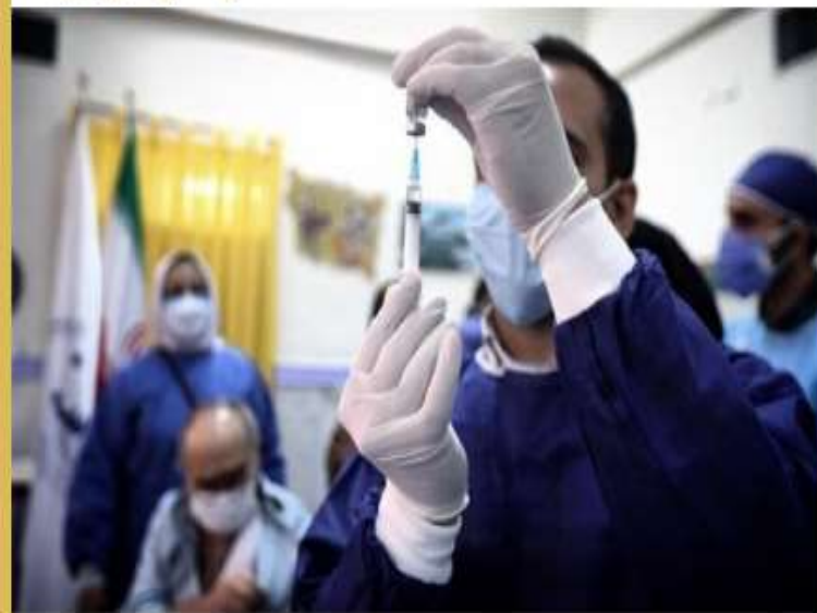
تزریق دُز چهارم واکسن کرونا در مازندران