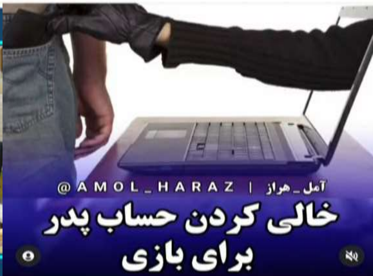
آمل - هراز | @AMOL_HARAZ

#عزل #مدیرکل #آموزش #پرورش #اخبار ساره #اخبار مازندران