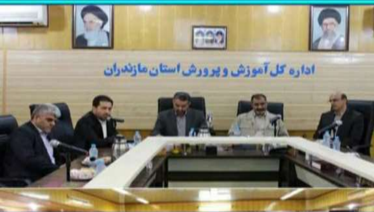
اداره کل آموزش و پرورش استان مازندران