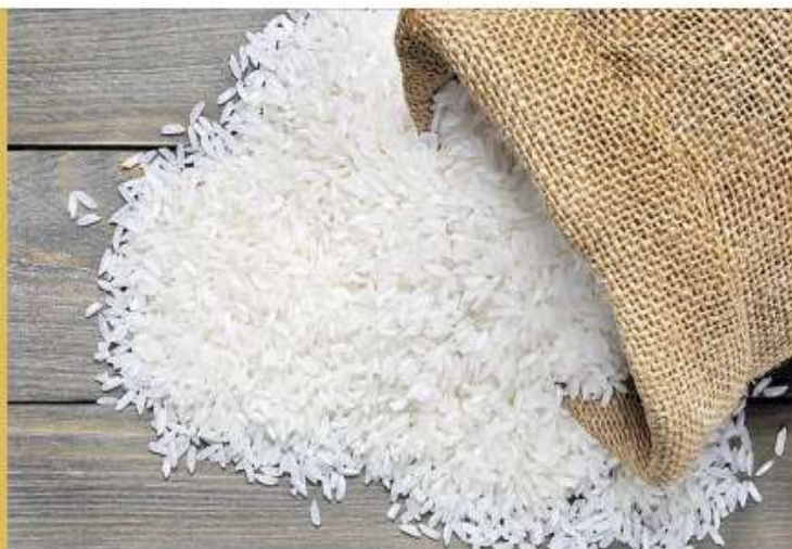
خداحافظی برنج با سفره مردم