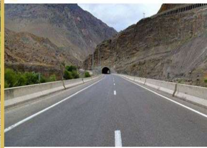
بسته شدن جاده هراز از امروز تا چهارشنبه