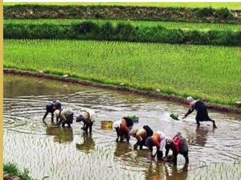
کشت قراردادی برنج در مازندران ۱۰ درصد بیشتر از سهمیه محقق شد

پرونده کشت قراردادی برنج در مازندران با عقد قرارداد در سطح حدود ۲۷ هزار و ۲۰۰ هکتار برای سال زراعی جاری در حالی بسته شد که این میزان حدود ۱۰ درصد بیشتر از سهمیه در نظر گرفته شده از سوی وزارت جهاد کشاورزی است.