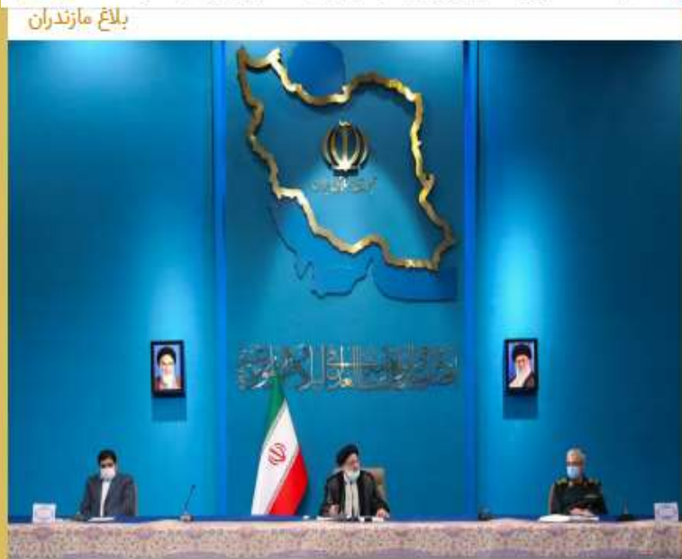
رئیس: آمادگی‌ها برای سویه‌های جدید کرونا حفظ شود

Pinned message ▼ دستور استاندار برای تنظیم بازار روغن مازندران/ ۲ هزار تن روغن شرکت