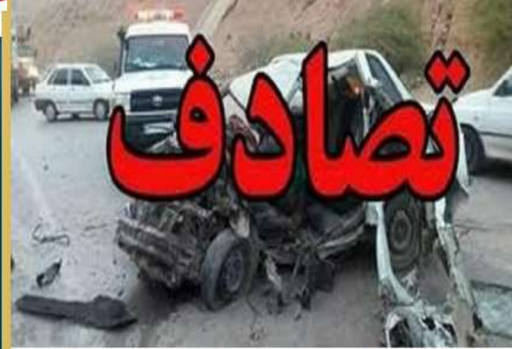
مرگ ۵۸۷ نفر در حوادث رانندگی مازندران