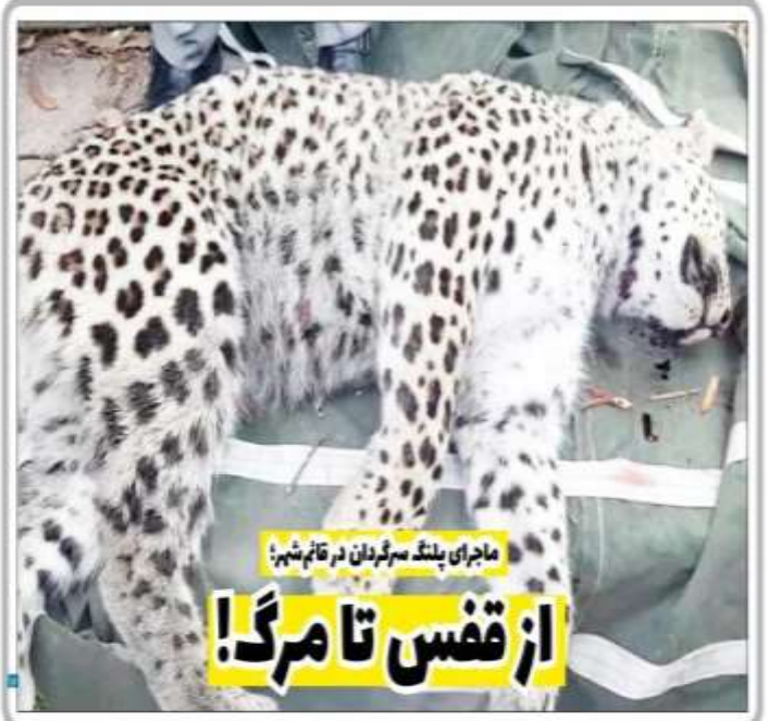
ماجرای پلنگ سرگردان در قائم شهر؛ از قفس تا مرگ!

بسیر خاتون ماسی ستاد بودجه و جمهوری اسلامی ایران