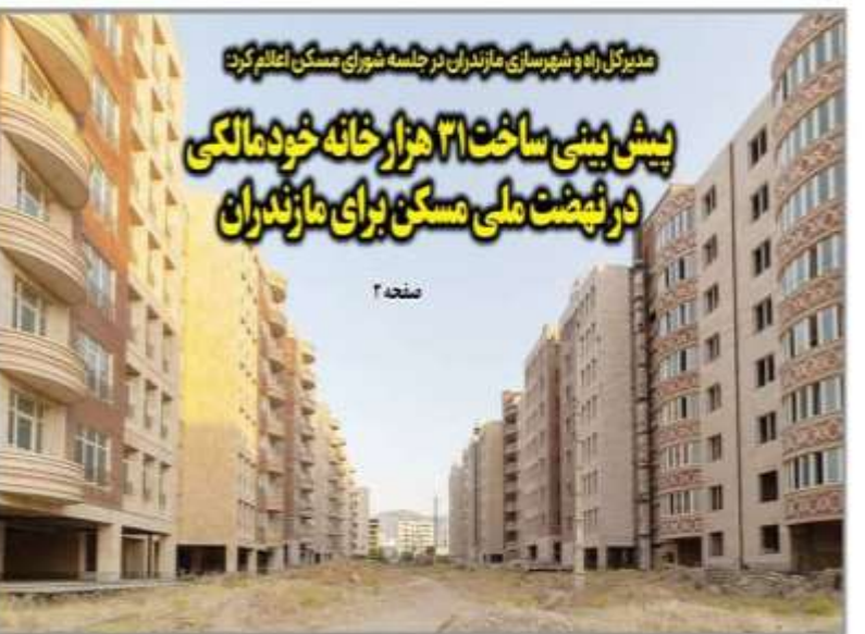
مدیرکل راه و شهرسازی مازندران در جلسه شورای مسکن اعلام کرد: پیش بینی ساخت ۳۱ هزار خانه خودمالکی در تهبخت ملی مسکن برای مازندران

کتابخانه جراحت دندل افزایش یافته تقدی است!