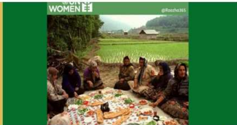
عکس زنان شمال ایران در سازمان ملل جعلی است

پوستری که طی روزهای اخیر با عنوان پوستر روز جهانی زنان روستایی با تصویری از زنان روستایی شمال ایران در فضای مجازی دست به دست می‌شود و حتی در برخی رسانه‌های رسمی نیز خیر آن منتشر شده، یک پوستر جعلی است که پیش از این نیز بارها در فضای مجازی بازنشر شده بود.