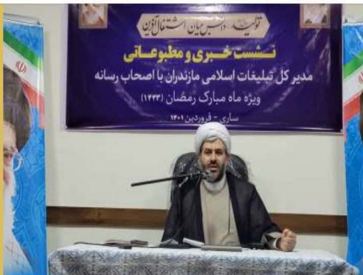
برنامه‌های سازمان تبلیغات اسلامی مازندران در ماه رمضان

♦ حرف آنلاین: مدیرکل سازمان تبلیغات اسلامی مازندران در نشست خبری ویژه ماه رمضان، از بازگشایی کامل مساجد بعد از دو سال خیر داد و به تشریح اقدامات این سازمان قبل و مخصوص این ماه پرداخت.