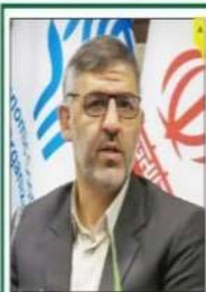
رئیس‌جمهور مازندران در شورای سیاست‌گذاری روداد بین‌المللی شهری ۲۰۲۲