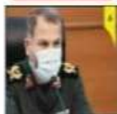
معاون استاندار مازندران

سال‌های مردم نهاد نیز در ایجاد فرهنگ رانندگی بخش مهمی داشته‌اند. پس باید به این نهادها اجازه داد تا در حوزه‌های مختلف فعالیت کنند و موجب ارتقا و پیشرفت اقتصاد کشور به‌طور کلی شوند تا اتفاق خوبی در جامعه پیش بیاید به عنوان یک کشور مهم و نامی کشور در حمل و نقل توجه داشته باشند در این صورت می‌توان انتظار داشت این مسئله به خوبی حل شود و در جامعه پدیده‌های گوناگون در توسعه یافته و صنعتی به‌سبب اینکه مردم بیشتر از جاگیت به ایمنی توجه می‌کنند توانسته‌اند آثار منفی عده‌ای را به میزان بالایی کاهش دهند