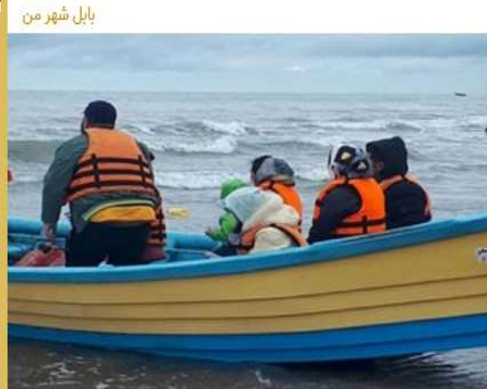
بابل شهر من

استقبال گسترده مسافران از تفریحات دریایی سواحل مازندران