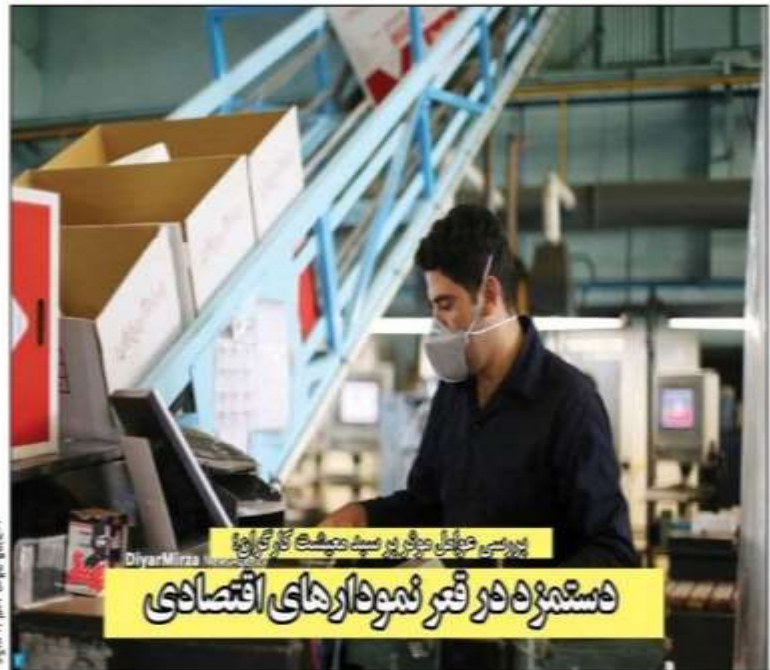
دستمزد در فقر نمونه‌های اقتصادی

بررسی سهم صادرات مازندران از بازارهای جهانی