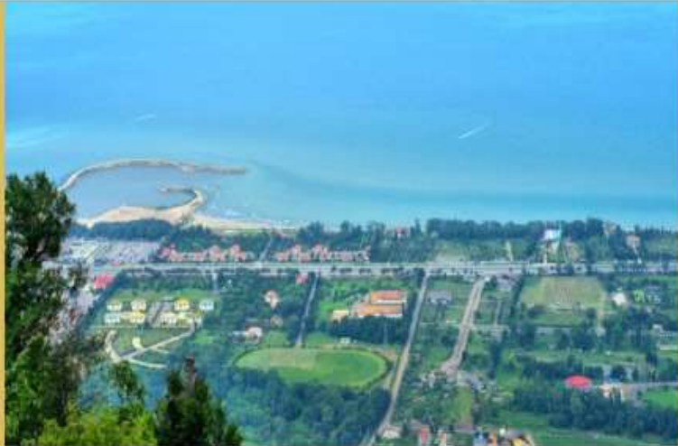
پیشنهاد ساخت بزرگراه ساحلی گلوگاه تا رامسر به #چینی‌ها

همشهری، شنبه، ۱۴ اسفندماه ۱۴۰۰ ▲ نسخه دیجیتال روزنامه را در سایت