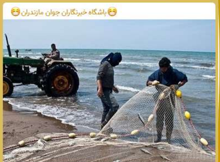
تور صیادان مازندرانی خالی‌تر شد