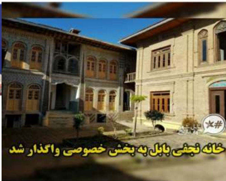
خانه نجفی بابل به بخش خصوصی واگذار شد

1,132 likes babolshahrebaharnarenj واگذاری خانه نجفی بابل به بخش خصوصی