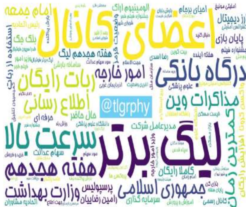
ابرواژه مطالب کانال‌های فارسی تلگرام در ۲۴ ساعت گذشته (برحسب تعداد مطالب)