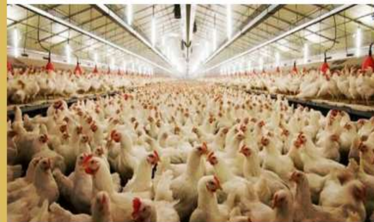
مازندران به مرز صادرات طیور رسیده است

معاون بهبود تولیدات دامی وزارت جهاد کشاورزی گفت: ظرفیت طیور در استان‌های گیلان، مازندران و گلستان افزایش پیدا کرده است به گونه‌ای که مازندران به مرز صادرات طیور رسیده است و می‌تواند نیاز سایر استان‌های کشور را تامین کند.