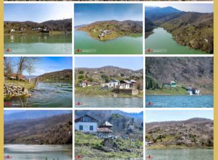
تخریب بناهای غیر مجاز در حریم سد البرز

رئیس کل دادگستری استان مازندران از تخریب بناهای غیر مجاز در حریم سد البرز در شهرستان سوادکوه شمالی خبر داد. با پیگیری‌های صورت گرفته و براساس گزارش رئیس حوزه قضایی سوادکوه شمالی وجود این بناهای غیر مجاز مانع از آبیگری سد بوده و خطرات و حوادث جانی و مالی را برای ساکنین بدنبال داشته و تخریب این سازه‌های غیر مجاز باعث پیشگیری از بروز حوادث خواهد شد.