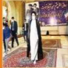
رئیس در حرم امامزاده نگاه امامزاده به مردم تشریفاتی نمود

سال نوزدهم • پنجشنبه ۱۴ بهمن ۱۴۰۰ شمسی • ایلرچب • ۱۴۲۲ قمری • ۲۰۲۲ قریه • ۲۰۲۲ میلادی • شماره ۳۲۳۸ • صفحه ۲۰۰ • تومان