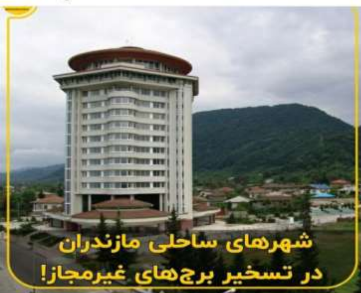
شهرهای ساحلی مازندران در تسخیر برج‌های غیرمجاز!