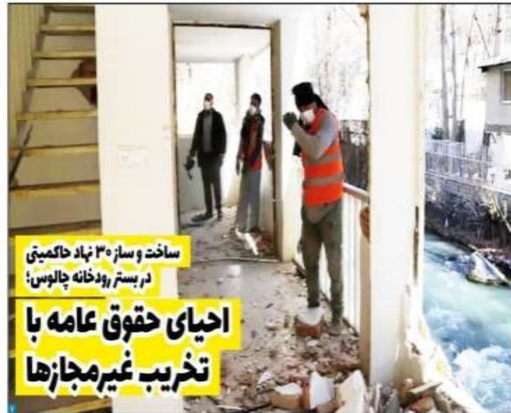
ساخت و ساز ۳۰۰ نهاد حاکمیتی در بستر رودخانه چالوس؛