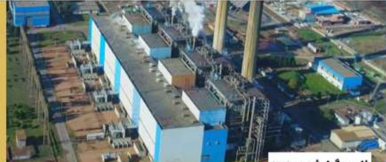
فارس گزارش می‌دهد