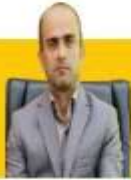
مدیرکل انفجاری و حمل و نقل جاده‌ای گیلان: