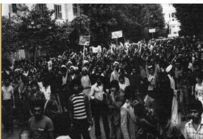
▲ واکاوای زرین‌ترین برگ از شناسنامه انقلاب اسلامی در مازندران؛

واقعه 18 دی 57، شناسنامه انقلابی مردم ساری/رمز نامگذاری خیابان 18 ▲