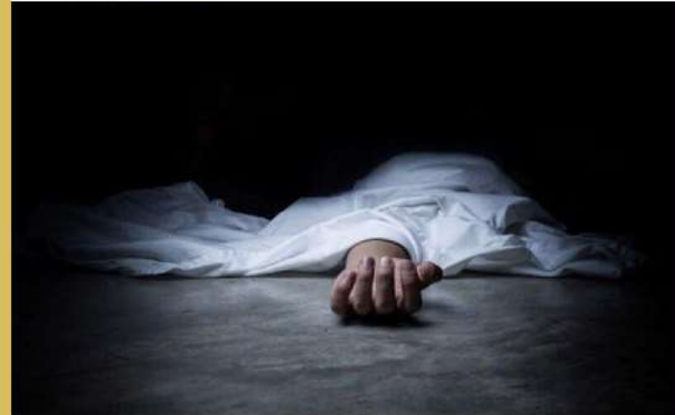
قتل، پایان میانجیگری جوان ساروی

معاون اجتماعی فرماندهی انتظامی مازندران گفت: در پی اعلام مرکز فوریت‌های پلیس ۱۱۰ مبنی بر وقوع یک فقره درگیری منجر به قتل در یکی از روستاهای حومه شهرستان ساری، و اعزام سریع ماموران کلانتری به محل وقوع جرم، در بررسی‌های اولیه میدانی مشخص شد، قتل جوان بیگناه نتیجه وساطت در حل و فصل دعوا بین دو جوان بود.