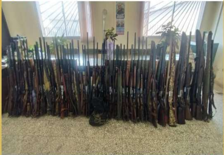
● کشف و ضبط ۷۲ قبضه سلاح غیرمجاز در مازندران

▲ ماموران یگان حفاظت محیط زیست حین گشت و کنترل در شهرهای #ساری، بابل، آمل، محمودآباد، میاندورود و بهشهر از شکارچیان غیرمجاز ۷۲ قبضه سلاح و لاشه چندین قطعه پرنده کشف و ضبط کردند.