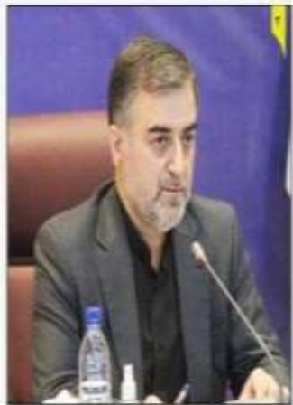
حسینی یوز استاندار در جلسه شورای هماهنگی بانک های مازندران بانک ها؛ در اقتصاد مازندران تولید فکر کنند